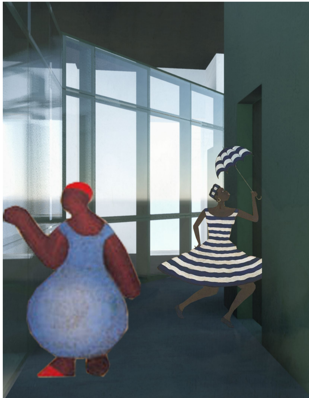
Núcleo de Circulação Vertical