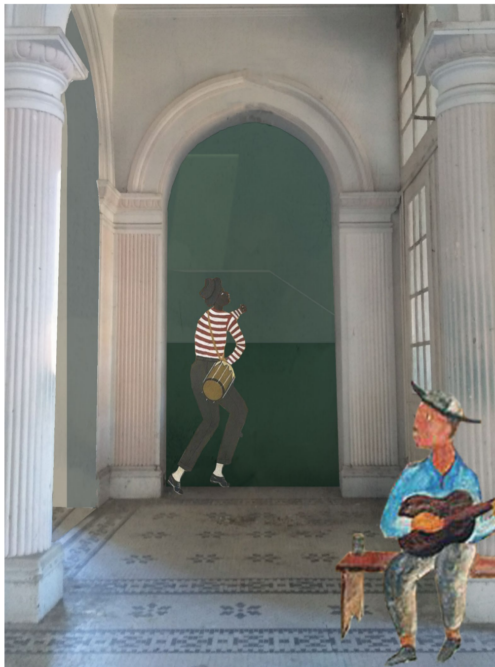
Conexão visual entre o Edifício Histórico e o Anexo